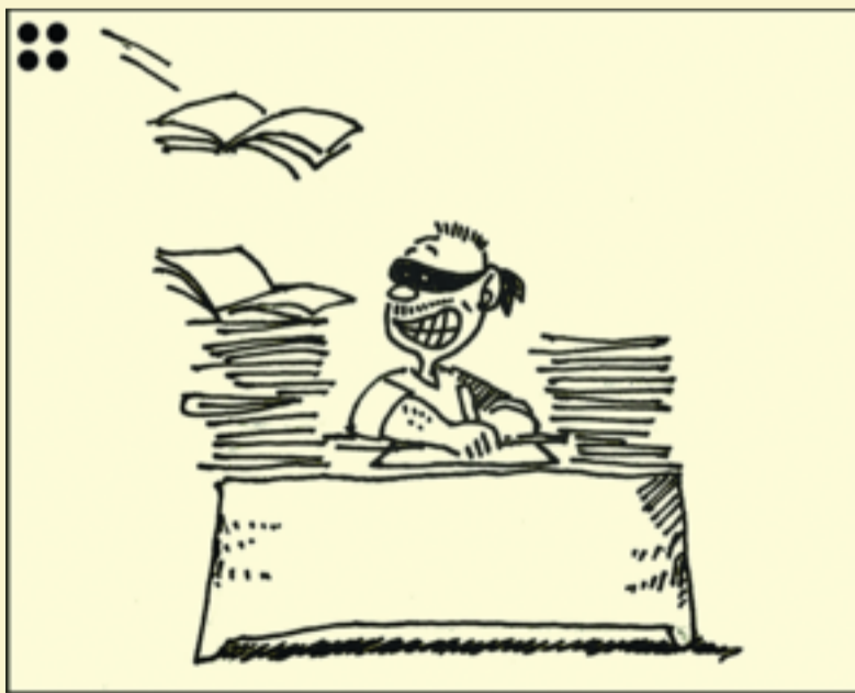
绘图/李俊 制图/张继